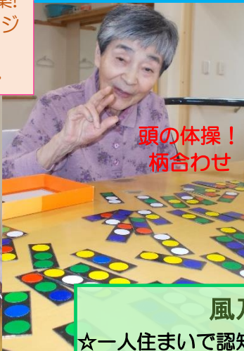
頭の体操！柄合わせ