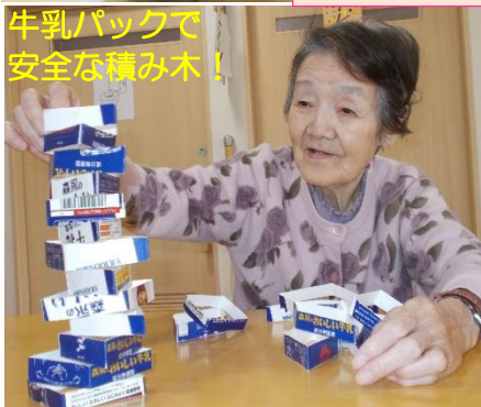
牛乳パックで安全な積み木！