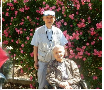
となみ チューリップ 四季彩館