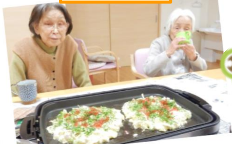
お好み焼&手作り餃子パーティです