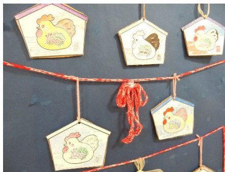
利用者さんの作品です