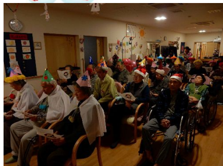
クリスマス会でキャンドルサービスをしました