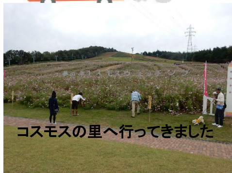
コスモスの里へ行ってきました