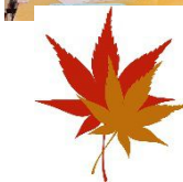
レクリエーション充実 していますよ