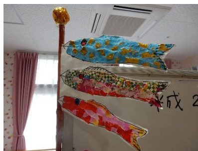
立体的なこいのぼり 利用者様の作品