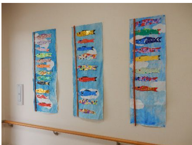
風乃里の玄関 貼り絵